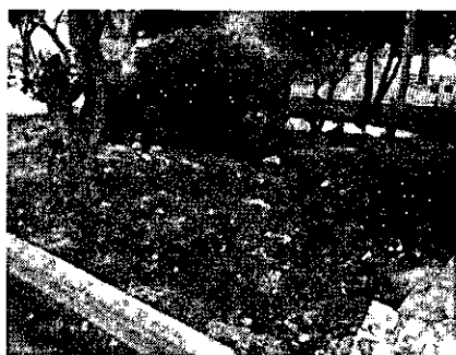
המתחם המיועד להקמת הגינה

"קריית יערים" זקוקה לפיתוח שטחים מזנחים שבתחומה. אנו מעוניינים לשנות מצב זה ולהקים במתחם שבמרכז הכפר גינת נוי ופנאי. גינה שתסייע ליצור עבור החניכים סביבת מגורים משופרת, נאה ומזמינה המחזקת את תחושת השייכות שלהם למקום ותורמת לתהליך הטיפול והשיקום שלהם. החניכים יהיו שותפים מלאים לתהליך ההקמה ובכך ייקחו חלק פעיל ומרכזי יותר בטיפול מרחב המחיה שלהם. עצם הדאגה לביתם והעבודה יחד יתרמו לגיבושם של החניכים כקבוצה בעלת מטרה משותפת ויפתחו בהם מודעות וכבוד לקהילה שבה הם חיים. פיתוח המתחם והקמת הגינה יעניקו לחניכים מקום למפגש ולהתאוורות ויתרמו לשיפור מראה הכפר ולטיפולו.